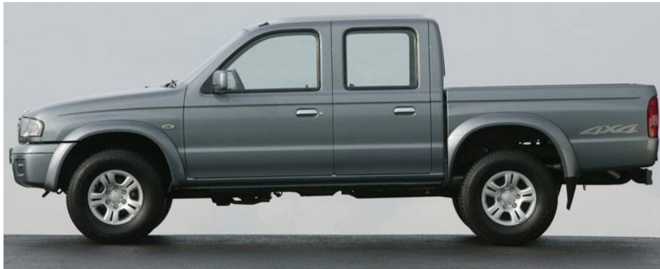
75. k) ábra: pickup