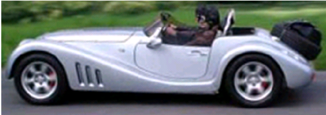
75. f) ábra: roadster