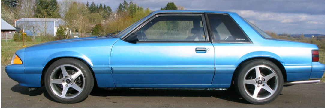
76. a) ábra: notchback

A notchback felépítmény valójában a szedánhoz áll legközelebb, azonban a hátsó csomagtartó fedele hosszabb, nyújtottabb. Kedvezőtlen menetellenállási tulajdonságokkal rendelkezik. Régebbi, főleg amerikai gyártmányok jellemzői. Manapság a notchback megjelölést a szedán alternatívájaként használják.