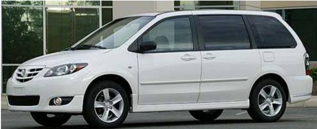
75. i) ábra: családi egyterű