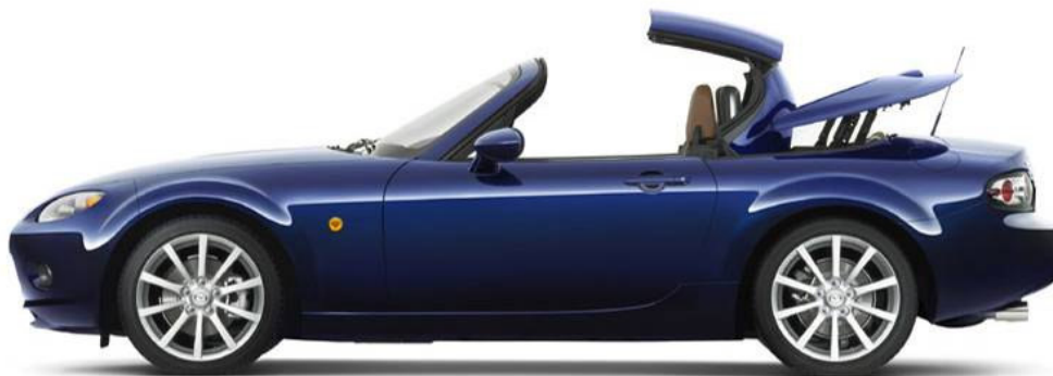
75. e) ábra: kabrió