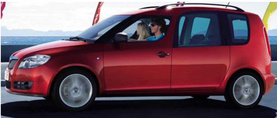
75. j) ábra: szabadidőautó