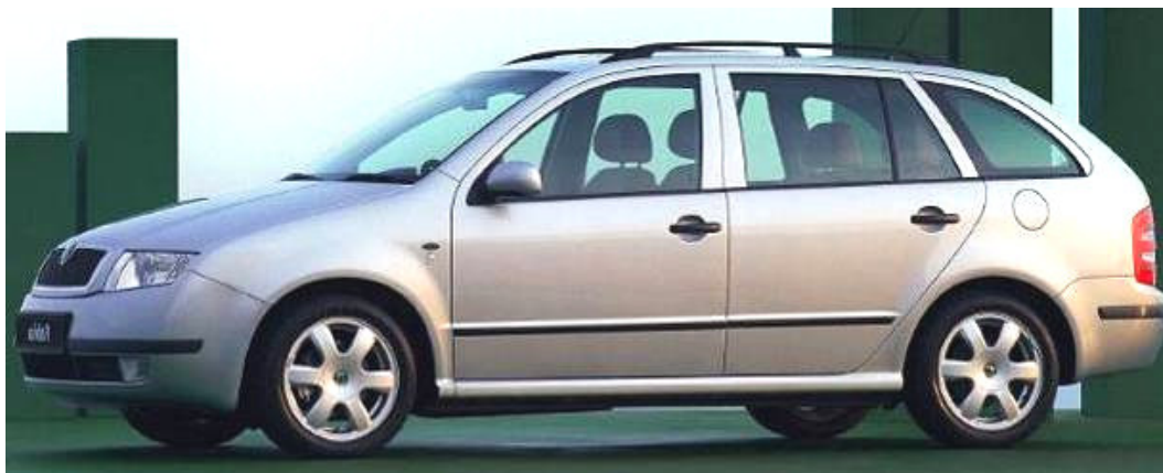
75. h) ábra: kombi