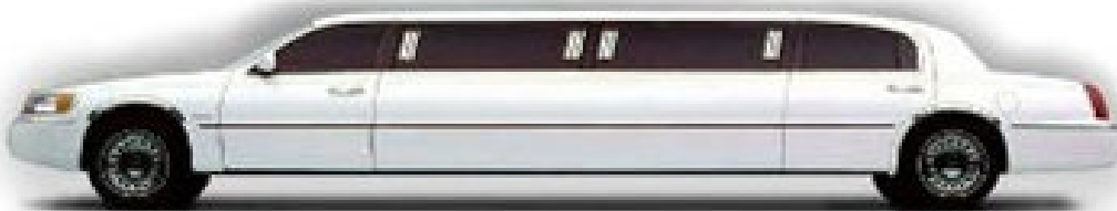
75. l) ábra: limuzin