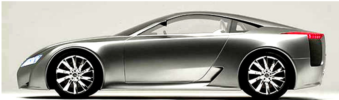
75. d) ábra: kupé