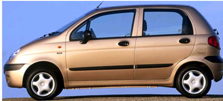
75. b) ábra: hatchback

Ülések száma: 2, maximum 4 teljes értékű