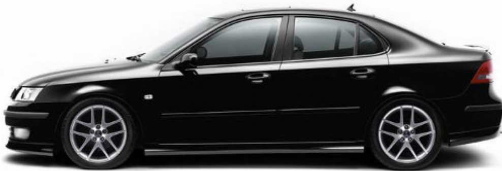
75. a) ábra: szedán