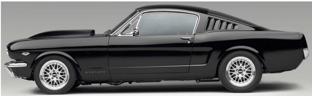
76. b) ábra: fastback

A kupéhoz közel álló, manapság már kevésbé használt típusmegnevezés. Azt hivatott jelölni, hogy a motorháztól meredeken emelkedő első szélvédő felső részétől a tető egy ívben kanyarodik végig egészen a csomagtartó ajtóig, aminek eléggé kis hely jut. Leginkább kétajtósként ismert sportautókra jellemző.