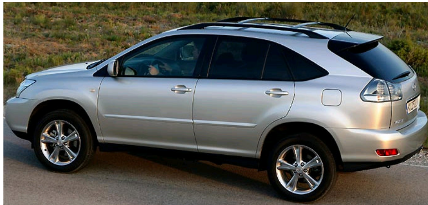
77. ábra: crossover SUV

Az új piaci szegmensek felfedezésének (kreálásának) igája alatt született meg a „crossover SUV” kategória, amit magyarul talán keresztezettnek lehetne fordítani. Ide azokat az autókat sorolhatjuk, amelyek a SUV jegyeit mutatják, de inkább a városi egyterűekhez állnak közelebb, mint a pickup-okhoz. Ötvözik mindkét „műfaj” jegyeit, SUV ágon az enyhén megemelt padlószintet és robusztusságot, míg MPV ágon a kezelhetőséget örökölték. Mind fogyasztás, mind aerodinamika szempontjából köztes pozícióban vannak.